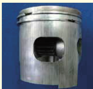
オイル不良 ピストンの異常磨耗 (全周に縦キズあり)