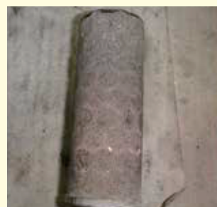
真空ポンプストレーナー ゴミ詰まりによる吸水不能