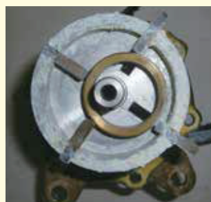
真空ポンプ ベーン固着による 作動不良及び吸水不能