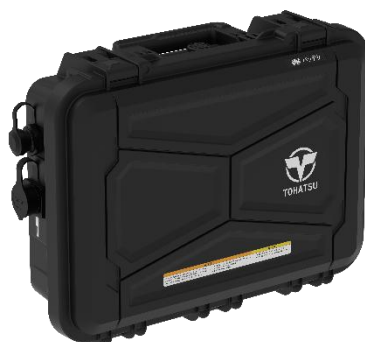
バッテリー(ケース付)