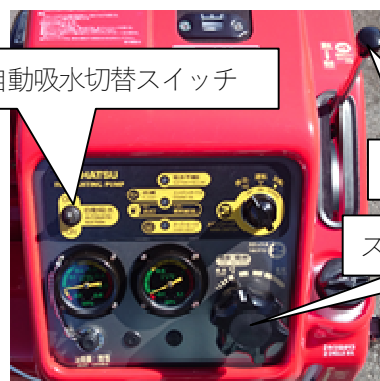
スロットルダイヤル