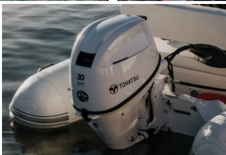
リモートコントロール仕様 ※PTT モデルのみ